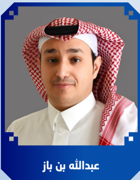
عبدالله بن باز