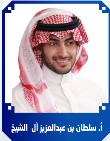
أ. سلطان بن عبدالعزيز آل الشيخ